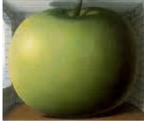
Рене Магрит, Соба за слушање

Ученицима покажемо репродукције и на тим примерима објаснимо светлину и како помоћу светлине добијамо облик. Питати ученике које облике смо добили помоћу валера на овим репродукцијама.